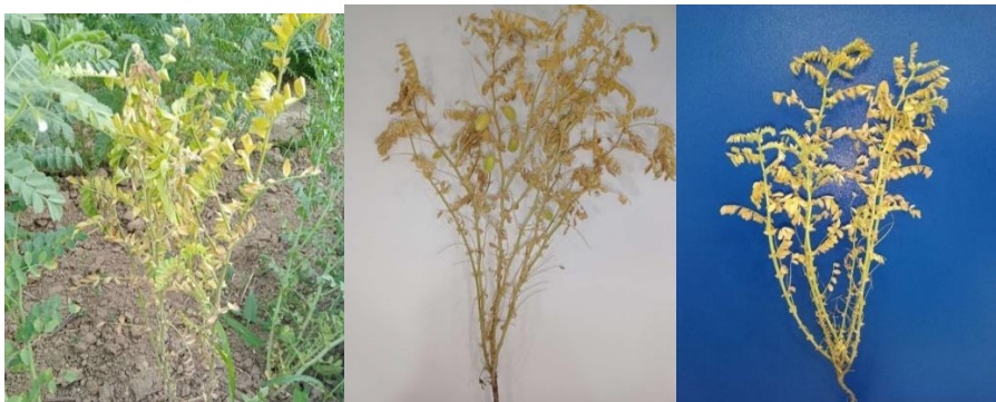
2-Rasm. No'xatning fuzarioz bilan kasallangan o'simlik namunalari.

soni ko'p, lekin mayda donli bo'lishi kuzatildi. Shu bilan birga gulband uzunligi ham dukkak hajmi bilan chambarchas bog'liq. Yirik donli no'xat namunalari ko'proq qismi CIENMED namunalari orasida ko'p uchradi. Namunalar ichida miqdoriy belgilari yaxshi ko'rsatkichga ega namunalarga CIFWN namunalari 17 tasida CIENMED namunalari 11 tasida yuqori ko'rsatkichga ega bo'ldi.