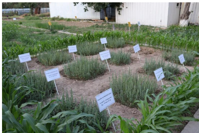
2-rasm. Tajriba maydoni

Tajriba maydoni tuprog'ining mexanik tarkibi. Tajriba maydoni tuproqlari eskidan sug'orilib kelinayotgan tipik bo'z tuproqlardir. Mexanikaviy tarkibiga ko'ra bu tuproqlar yirik changli o'rta qumoq, undagi fizikaviy loy (0,1mm zarrachalar) funksiyasining miqdori 39 – 44%, Chirchiq suvlari changlari (0,05 – 0,01mm zarrachalar) 45 – 52%. Barcha lyoss jinslarda kuzatilgan kabi bu tuproqlarda ham 0,25 mm dan yirik zarrachalar miqdori juda kam.