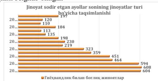
2-Rasm. Ro'yhatga olingan jinoyatlar bo'yicha ayollar ishtiroki

Mavzuning metadalogiyasi. Ushbu mavzuning obykti sifatidan giyohvandlik bilan kurashayotgan soha mutaxassisleri, bevosita va bilvosita giyohvandlik bilan kurashayotgan mahalla faollari tanlab olingan. Mavzuning predmeti sifatida yoshlar va xotin-qizlar orasida giyohvandlik va zaharvandlikning tarqalishi bilan bog'liq ijtimoiy-iqtisodiy, epidemiologik, jihatlarini o'rganish hamda yoshlarning giyohvandlikning salbiy oqibatlaridan xabardorligini ta'minlash va iste'moli profilaktikasini amalga oshirishni aniqlash belgilab olingan