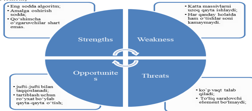
3-rasm. Pufaksimon saralashning SWOT tahlili.

➤ Threats – Pufaksimon saralash algoritmining xavf xatar tomonlari;