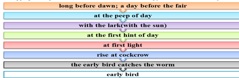
1-rasm. Ingliz madaniyatida "erta" tushunchasining ahamiyati

Madaniy almashinuv Toledo tarjima maktabi orqali o'zining eng yuqori cho'qqisiga chiqadi. Toledo maktabida