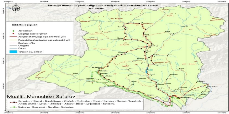
2-rasm. Sariosiyo tumani bo'ylab tuzilgan rekreatsiya-turizm marshrutlari kartasi

- Sariosiyo shaharchasi - Hisorak - Kundajuvoz - Zinchob - Xushxabar - Mizat - Hurvatan - Shotrut - Tamshush - Artush dovoni - Xovat - Zombog' - Xabaro - Billur - Xo'jaosmin - Sariosiyo shaharchasi.