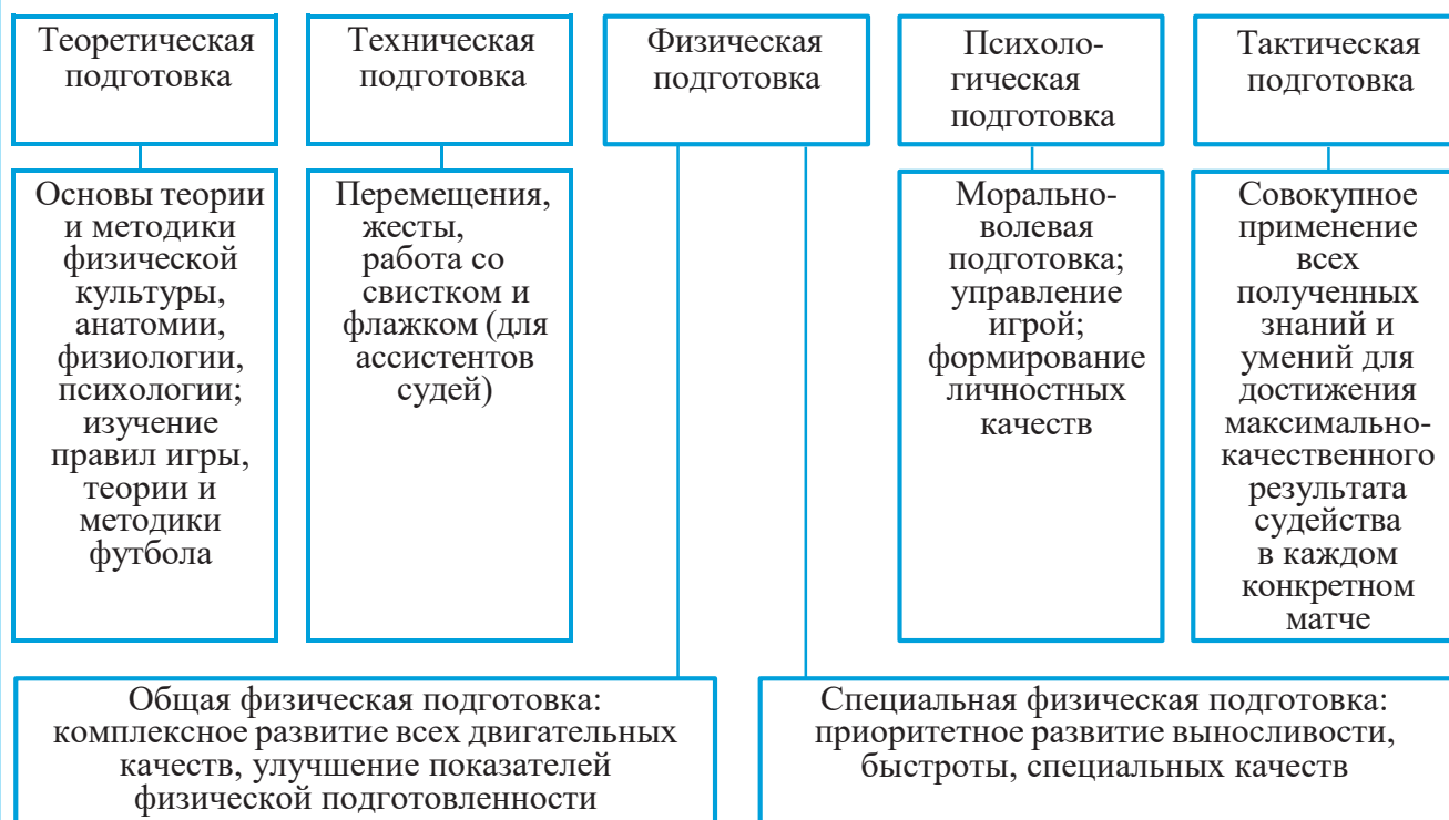
Схема. Основные составляющие подготовки судьи по футболу

Важной частью подготовки футбольного арбитра выступает теоретическая составляющая, включающая глубокое понимание регламента игры, положений о проведении турниров, особенностей системы розыгрыша, принципов организации и осуществления матчей, методик фиксации итогов соревнований посредством ведения протоколов, правильного оформления судейской документации, а также нюансов судейства футбольных состязаний, выступающих в качестве универсального руководства для судий.