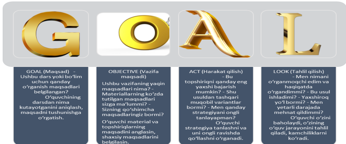
1.2-rasm GOAL sxemasi

Ushbu tizim o'quvchini o'z bajarayotgan vazifasiga o'rganish strategiyalarini tatbiq etishga undaydi. Bunga o'quvchi o'quv vazifasini bajarayotganda o'ziga beradigan "o'z-o'zini so'roq qilish" savollari orqali erishiladi.