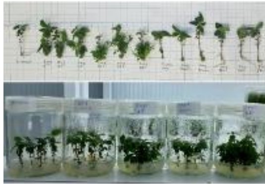
1-rasm. A. melonacarpa ning BAP, 2 iP, kinetin va GA_3 ning turli konsentratsiyasidan olingan mikroklonlar.

Natijalar va tahlili. O'simlik gormonlari BAP, 2 iP, kinetin va GA_3 o'simlik gormonlarining turli konsentratsiyasidan (1, 2, 3 mg/l) olingan natijalar o'zaro bir biridan miqdor va sifat ko'rsatkichlari jihatdan farq qildi (1-rasm).