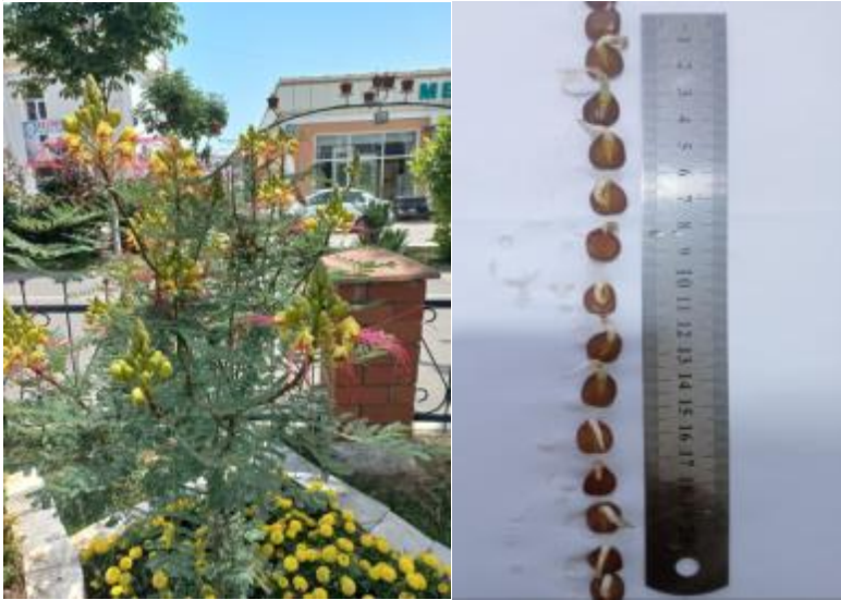
1-rasm Caesalpinia gilliesii Wall.

uzunligi 2-3 (5) m gacha bo'lgan buta. Argentina va Urugvayda tabiiy holda tarqalgan. Burchoqdoshlar (Fabaceae L.) oilasiga mansub Caesalpinia gilliesii Wall. yuqori manzaraliligi va xo'jalikdagi ahamiyati uchun dunyoning juda ko'p mamlakatlarida madaniy holda o'stiriladi [1]. Barglari uzunligi 1-2 sm, yashil, siyrak qisqa bargli, ikki marta patsimon bo'lib, qorong'i tushganda yopiladi. Gullari sariq rangda, gultojbarglari orasidan osilib turuvchi uzun qizil changchilari bilan boshqa o'simliklardan ajralib turadi. Har bir gul qisqa muddat ochiladi, ammo ketma-ket ochiladigan kurtaklarining ko'pligi sababli gullashi uzoq muddat davom etadi. (1-rasm).