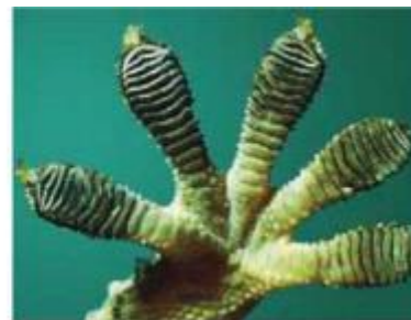
1.1-rasm - Tirik tabiatdagi nanostrukturallari: a - mikroskop ostidagi lotus barglari; b - gekko panjasi