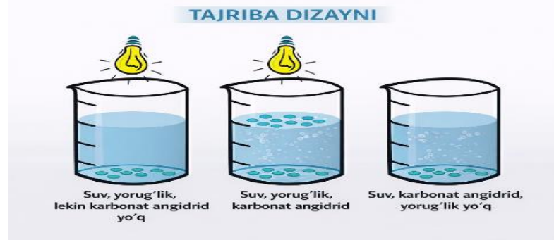
1-rasm. “O‘simliklar fiziologiyasi va bioximiyasi” fanida fotosintez jarayonini STEAM yondashuvi asosida o‘rganish

almashinuvi va matematik modellashtirish orqali tahlil qildilar. Natijada ilmiy-tadqiqotchilik va integrativ kompetensiyalar shakllandi.