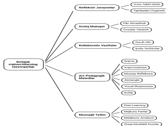
Bo'lajak o'qituvchilarning psixologik va pedagogik tayyorgarligi

Ushbu rasmda bo'lajak o'qituvchining kasbiy shakllanishini beshta fundamental komponent orqali ifodalaydi. Har bir komponent o'zaro iyerarxik bog'liqlikda bo'lib, yakuniy maqsad-kollaborativ kompetensiyani shakllantirishga yo'naltirilgan. Art-pedagogik texnologiyalarning samarali ishlashi uchun moddiy-texnik resurslar-vizual materiallar, rangli materiallar, multimediya vositalari, sahna atributlari, musiqa jihozlari, grafik vositalar, yorug'lik va ovoz texnologiyalari bilan ta'minlash ham ta'lim muassasasining muhim pedagogik sharoitidir. Mazkur sharoitlarga qo'shimcha ravishda mashg'ulotlarni tashkil qilishda modul-topshiriqlar tizimi, jamoaviy loyihalar, badiiy kompozitsiyalar yaratish, sinfda badiiy ifoda uchun xavfsiz joy ajratish, vaqtni to'g'ri rejalashtirish, art-pedagogik faoliyat jarayonida individual va guruh dinamikasini kuzatib borish kabi tashkiliy-metodik jihatlar ham alohida e'tibor talab qiladi. Shuningdek, bo'lajak o'qituvchilarning art-pedagogik texnologiyalarni amaliyotga tatbiq etishi bo'yicha monitoring, diagnostika, professional