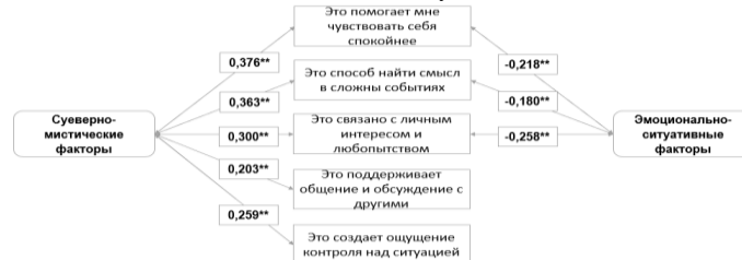
Рис.3. Корреляционный анализ факторов, влияющих на учебно-профессиональную деятельность и мотивов

Как показывают результаты (рис.2), что между изученными факторами существуют слабые обратные связи. Так, суеверно-мистические установки у студентов слабо отрицательно коррелируют с эмоционально-ситуативными реакциями, что означает: чем выше выраженность суеверности и склонности к мистическим практикам, тем ниже проявление эмоциональной реакции в конкретных ситуациях. Аналогично, эмоционально-ситуативные реакции слабо и обратно-пропорционально связаны с индивидуальными чертами личности, что свидетельствует о том, что у студентов с более выраженными личностными характеристиками ситуативная эмоциональная реакция проявляется немного слабее.