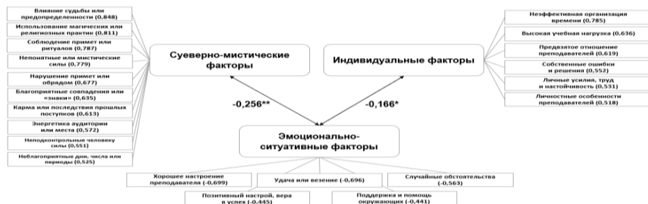
Рис.2. Корреляционный анализ факторов, влияющих на учебно-профессиональную деятельность

карта) и амулеты и талисманы «на удачу», что согласуется с данными таблицы, где эти практики остаются наиболее узнаваемыми и значимыми для студентов. А практики типа регрессологии (воспоминания прошлых жизней) и работы с чакрами демонстрируют умеренный рост к 3 курсу, после чего их средние значения падают на 4 курсе, что может свидетельствовать о формировании более критического отношения к менее научно обоснованным методикам по мере продвижения в обучении. Наименее популярными остаются онлайн-прогнозы и цифровые эзотерические сервисы, их средние значения остаются низкими на всех курсах, что отражает скепсис студентов по отношению к новым или цифровым формам эзотерики.