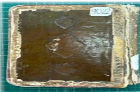
5-rasm: Ahmad ibn Yahyo ibn Muhammad ibn Sa‘d at-Taftazoniy. “Sharh aqoid an-Nasafiy”. 768/1367-yili yozilgan. O‘zRFaSHI qo‘lyozmasi №9022/1.