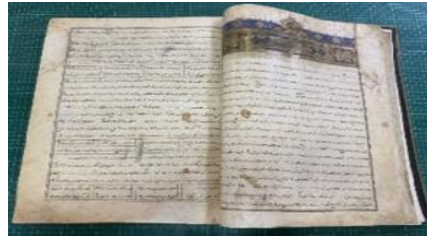
(2-rasm): O'zR Fa SHI fondidagi №3440 tartib raqamli "Zafarnoma qo'lyozmasi" ning 42-varaqdagi unvon bilan bezatilgan matn qismi

Manbalar va adabiyotlar tahlili. Tarixiy manbalarda aks etishicha Temur katta bilimdon va yuksak ma'rifat sohibi bo'lgan, o'zi garchi madrasa kutubxonalar qurmagani bo'lsada, ilmu-ma'rifat ahliga homiylik qilgan. Bu borada mashhur tarixchi Sharafiddin Ali Yazdiyning "Zafarnoma" asarida keltirilgan. Temuriylar davriga oid qimmatli manbalardan biri bo'lmish mazkur asar hozirda O'zbekiston Respublikasi Fanlar akademiyasi Sharqshunoslik instituti fondida saqlanayotgan "Zafarnoma" asari qo'lyozmasidir (1-rasm). Uning tartib raqami – №3440. O'lchami – 35x49,5 sm bo'lib, 239 varaqdan tashkil topgan. Matn suls xatida bitilgan bo'lib, har sahifasida