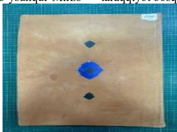
(1-rasim): O'zR Fa SHI fondidagi №3440 tartib raqamli "Zafarnoma qo'lyozmasi

(1409 -1449), Sulton Husayn, Alisher Navoiy, va Kamoliddin Behzod (1449-1506) davrlarida nafis san'at o'zining barakali uch taraqqiyot bosqichini bosib o'tdi. Temuriylar davrida ilmufan bilan bir qatorda tasviriy san'at, ilmiy va badiiy asarlarni husnixatga ko'chirish, ularni miniatyuralar bilan bezash, shuningdek, nafis kitobat san'ati yuksak rivoj topdi. XIV-XV asrlar Temuriylar davrida kitobat va miniatyura san'ati yangi taraqqiyot bosqichiga ko'tarildi.