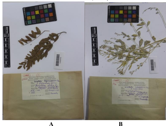
2-rasm. Omonqo'ton hududidan yig'ilgan chang zamburug'lari bilan zararlangan o'simlik gerbariy namunalari: A – Leveillula taurica f. glycyrrhizae Jacz. (yig'uvchi: Panfilova, yil: 1957). B – Leveillula rutae (Jacz.) U. Braun. (yig'uvchi: Ramazanova, yil: 1957).

Xulosa va takliflar. Olib borilgan tahlillar shuni ko'rsatadiki, 2022-yilda tashkil etilgan Omonqo'ton milliy tabiat bog'i hududi mustaqil mikologik obyekt sifatida kompleks va maxsus tarzda tadqiq etilmagan. Mavjud gerbariy materiallari esa milliy