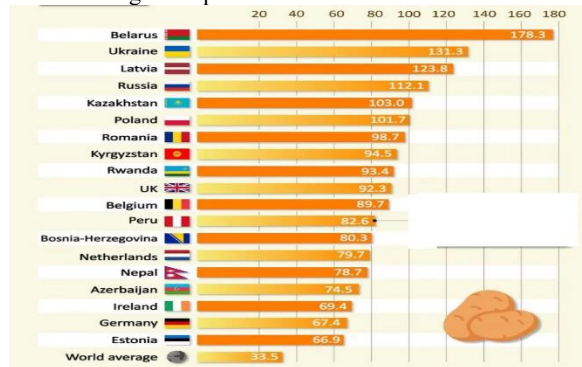
1-rasm. Kartoshka iste'moli bo'yicha dunyoning top-20 talik mamlakatlari dinamik ko'rsatkichi

Aniqlanishicha Shimoliy Amerika kartoshkasini ko'proq iste'mol qilish yuqori xavf bilan bog'liq 2-toifa diabetni 33% ga oshirishi aniqlandi [6]. Organizmda gipertenziya rivojlanish xavfining mavjudligi ham ushbu kartoshka iste'molida kuzatilgan (Borgi L, Rimm EB,). AQSh da aholi orasida kuzatilayotgan o'lim sonining asosiy massasini (saraton, insult, yuqurak qon tomiri tizimi kasalliklari) kartoshka iste'moli bilan bog'lamoqdalar.