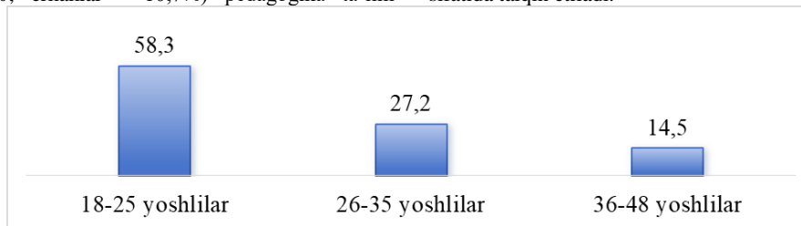
2.1.2-rasm. Respondentlarning yosh guruhi haqida birlamchi statistik ma'lumot.

yo'nalishining real demografik tuzilmasini aks ettiradi va O'zbekiston oliy ta'lim statistikasi bilan hamohangdir. Shu sababli ushbu nomutanosiblik tadqiqot cheklovi sifatida emas, balki o'rganilayotgan kontingentning obyektiv xususiyati sifatida talqin etiladi.