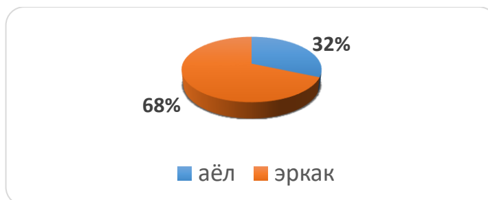
2-rasm. O'tkazilgan tadqiqotning hududlar kesimida ekspertlarni jinslar bo'yicha bo'linishi

Mazkur tadqiqotning asosiy mohiyati sotsial kapitalni quyidagi milliy xususiyatlarini asosidagi o'lchovini o'rganishdan iborat bo'lib, unda quyidagi indikator o'rganildi: