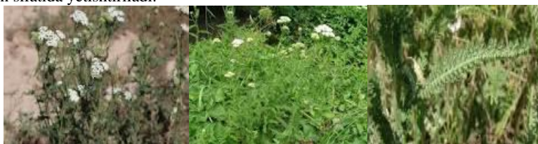
1-rasm. Bo'yimadaron ( Achillea millefolium L.) o'simligining morfologik qismlari

Achillea millefolium L., ya'ni boymadoron o'simligi Asteraceae (murakkabguldoshlar) oilasiga mansub ko'p yillik dorivor o'simlik bo'lib, Yevropa, Osiyo va Shimoliy Amerikada keng tarqalgan. O'zbekiston hududida ham tabiiy holda uchraydi va ayrim hududlarda madaniy ekin sifatida yetishtiriladi.