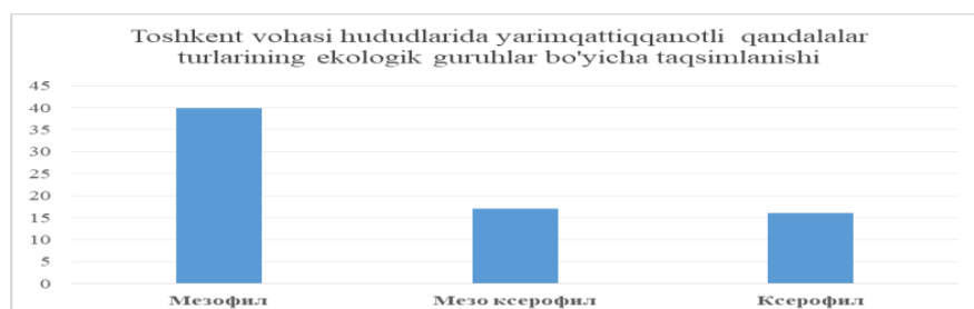
2 – rasm. Yarimqattiqanotlilarning yashash muhitiga ko'ra guruhlanishi.

Jadvaldan ko'rinib turibdiki, aniqlangan qandala turlarining eng ko'pi 41 tur ya'ni mezofillarga, 16 tur mezo - kserofillarga kirgan bo'lsa, kserofil guruhiga 17 tur kirganligi qayd etildi.