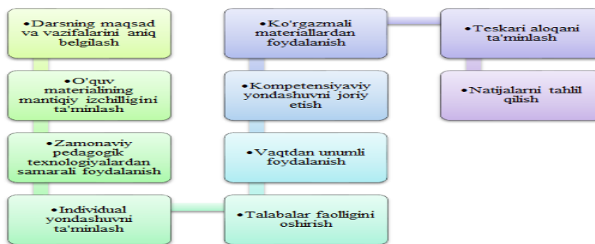
Dars turini tashkil etishdagi umumiy talablar

Darslarni tashkil etishda interfaol metodlar, axborot texnologiyalari, amaliy yo'naltirilgan topshiriqlar, individual yondashuv va kompetensiyaviy yondashuvdan foydalanish tavsiya etiladi. Bu zamonaviy yondashuvlar ta'lim sifatini oshirish va talabalarining faolligini ta'minlashga xizmat qiladi.