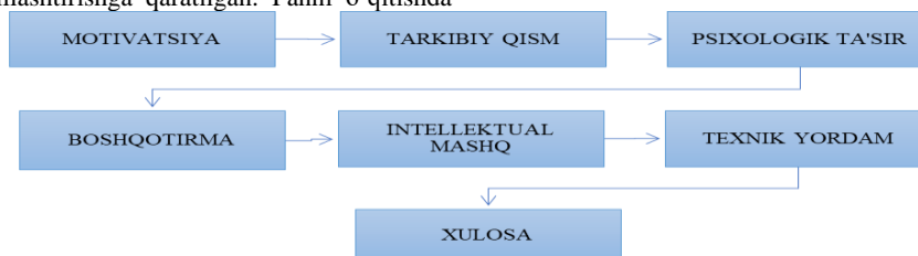
1-rasm. Ijodkorlik qobiliyatlarini rivojlantiruvchi integrativ topshiriqlarni bajarishga yo'naltirilgan mashqlar

"Xorijiy til" fani bo'yicha I kurslarga mo'ljallangan (nofilologik yo'nalishda hamda ikkinchi xorijiy til sifatida ingliz tilini o'qitish) ishchi fan dastur oliy ta'lim tizimidagi talabalarining ingliz tili bo'yicha bilim, ko'nikma va malakalarini takomillashtirishga qaratilgan. Fanni o'qitishda