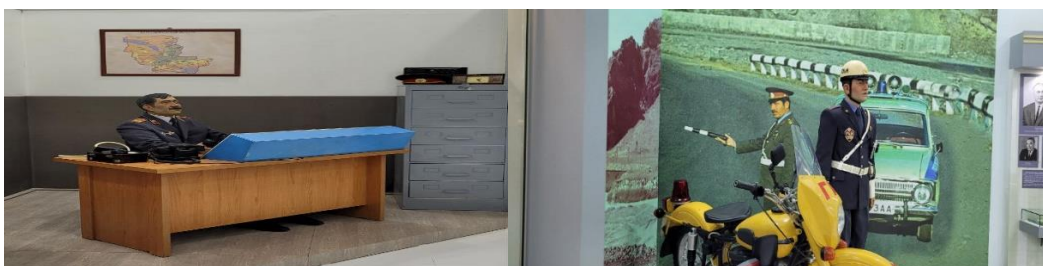
1-2-rasm. Jizzax viloyati ichki ishlar boshqarmasi muzeyi. 2022-yil.

Jizzax viloyati Ichki ishlar organlari tarixi muzeyi to'rt bo'limdan iborat. Muzey dizaynini yaratishda qator kreativ yechimlar qo'llanilgan. Ekspozitsiya asosini illyustrativ, kompleks, tematik, ansambl metodlari tashkil etadi. Har bir metod imkoniyatidan ma'lum bir mavzuni yoritishda, muzey eksponatlardan kelib chiqqan holda o'z o'rnida foydalanilgan. Muzey kolleksiyasida mavjud miltiqlar, qo'lbola pistoletlar, kalibrlar, mauzer kabi o'qotar qurollar, ofitserlarning qadimiy qilichlari tematik metod yordamida dizaynerlik loyihasidan foydalanib tomoshabinlarga taqdim etilgan. Mulyajlar vositasida o'rta asrlarga xos mirshablar ko'rinishi yaratilgan. Kompleks metod yordamida ichki ishlar tizimida foydalanilgan harbiy liboslarning xronologik o'zgarishi ko'rsatib berilgan. Fonda esa viloyat ichki ishlar boshqarmasining binosining tadrijiy o'zgarishi namoyish etilgan. General-larning 1970-yillardagi va hozirgi kundagi formasi ham taqqoslash uchun qo'yilgan. 1970-yillardagi generallar libosi Jizzax viloyati Ichki ishlar tizimining birinchi rahbari general mayor Yorulla Norbekovga tegishi ekanligi bilan muzeydagi noyob eksponat hisoblanadi.