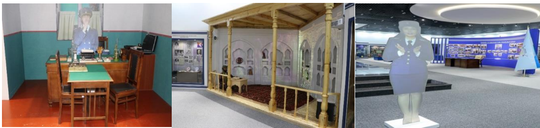
3-4-5-rasm. O'zbekiston prokuraturasi tarixi muzeyi. 2022-yil.

Bir kuni Buxoro amirligida tungi qorovul bilan savdogar o'rtasida kelishmovchilik tufayli savdogar uyida yong'in sodir bo'ladi. Donishmand Qozikalon Muhammad Isoxon ishini astoydil tekshiradi, chunki uning qaroriga qarshi chiqish mumkin emas. Hatto eng kichik xatolik ham tarozining pallasini noto'g'ri tomonga og'dirishi mumkin. Hakamning ko'pyillik tajribasi, ustozlarining bilimini chuqur egallashi haqiqat mezoni hisoblanadi. Qozikalonning adolatli va dindor bo'lganligi mahkamada adolatli qaror chiqarish imkonini beradi.