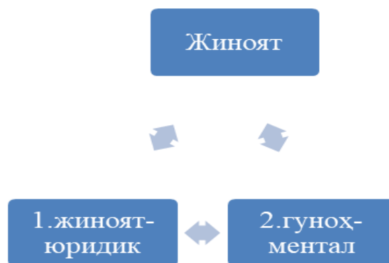
1-chizma. «Jinoyat» konseptining dastlabki tarkibi

Tahlil va natijalar. Demak, o'zbek tilida olamning lisoniy manzarasida «jinoyat» konsepti bevosita «gunoh» tushunchasi bilan ifodalanadi. Bunda biz «jinoyat» konseptiga «ikki shoxli tushuncha» sifatida qarashimiz mumkin.