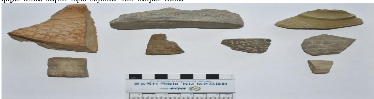
(5-rasm) O'simlik tasviri tushurilga bosma naqshli sopol buyumlar

O'simlik tasviri tushurilgan bosma naqshlar orasida qo'lga kiritilgan sopol buyumlarning ichida faqat bitta sopolda yaxlit bir o'simlikning tasvirlanganini kuzatishimiz mumkin. Bu o'simlik shakli ko'ra ko'knorni eslatadi. Biroq sopollarning davriy kelib chiqishini hisobga olsak bu gipoteza haqiqatga unchalik to'g'ri kelmaydi. Chunki bu davr Qashqadaryo aholisi islom diniga etiqod qiluvchilar bo'lib, ko'knorini istimol qilish diniy etiqodlariga mutloqo zid bo'lgan. Xulosa qilib shuni aytishimiz mumkunki hozircha buni qanday o'simlik ekanligi borasida hali bir to'xtamga kelinmadi.