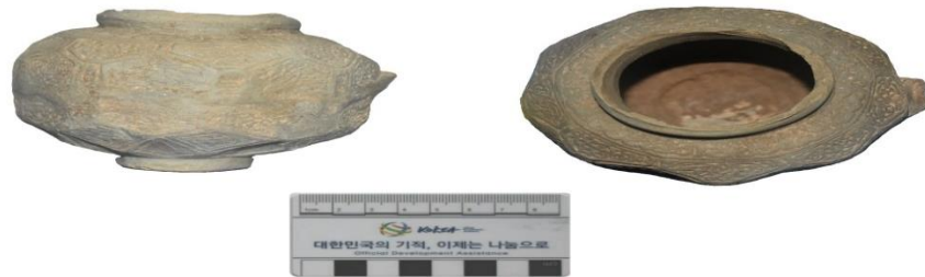
(3-rasm) Xo'ja Buzruk tepadan topilgan xumcha