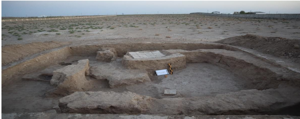
(2-rasm) Xo'ja Rushnoi arxeologik yodgorligidagi 3-qazishma

jarayonida va bevosita shu yilning avgust-sentiyabr oylarida olib borilgan tatqiqotlar jarayonida to'plangan. Topilmalar asosan yodgorlik ustida sochilib yotgan yuza materiallardan yig'ilgan, faqatgina ikki dona bosma naqshli sopol 2023 yilda olib borilgan tatqiqotlar jarayonidagi 3-qazishmadan topilgan.