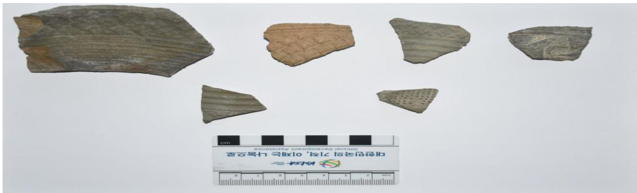
(4-rasm) Giyometrik shakl berilgan bosma naqshli sopol buyumlar.

Geometrik bosma naqshli sopol buyumlar orasida kichik nuqtali qilib naqsh berilgan sopollar ham mavjud. Sopol yuzasida ikkita chiziq tortilishi orqali malum bir kattalikdagi yo'lak hosil qilingan va manashu maydonchaga ko'plab kichik nuqtalar qo'yilishi bilan naqshlar hosil qilingan.