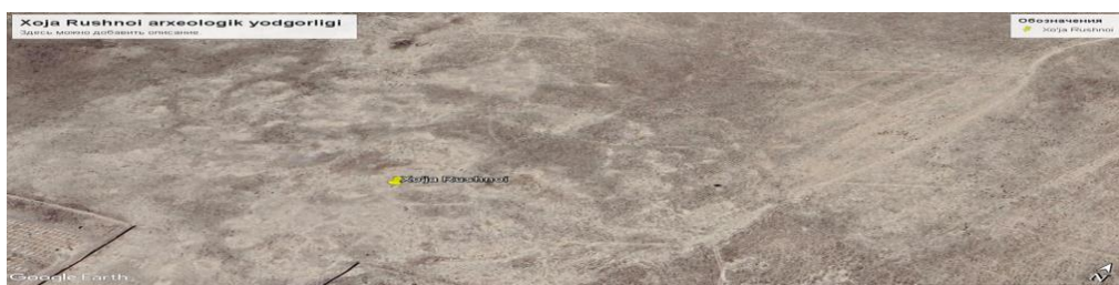
(1-rasm) Xo'ja Rushnoi arxeologik yodgorligi

Tatqiqot metodologiyasi. Tadqiqotning metodologiyasi tarixiy-qiyosiy, ob'ektivlik, davriy-muammoviy va retrospektiv tahlil etishga asoslanadi. Bugungi kunda dunyo fanida tarixiy tadqiqotlar bo'yicha qo'lga kiritilayotgan yutuq va yangiliklardan, ayniqsa, ko'pchilik dunyo olimlari tomonidan qabul qilingan tadqiqot usullari va yondashuvlardan imkon qadar foydalanishga harakat qilindi.