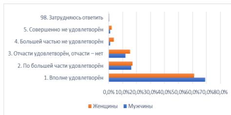
Рис.3. Удовлетворенность жизнью респондентами, %

При этом следует обратить внимание на то, что социальное самочувствие отражает способ реагирования на наиболее беспокоящие проблемы населения, в этом аспекте, мы можем видеть, что наблюдается различие в ответах мужчин и женщин – если мужчины склонны опираться на себя в решении своих проблем, то женщины проявляют намерение ничего не предпринимать или обращаться в органы государственной власти и