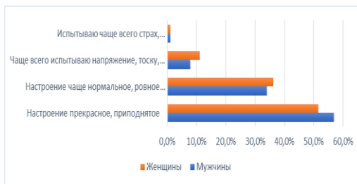
Рис.2. Какое настроение Вы испытываете чаще всего в последнее время?

Логично, что одна из категорий социального самочувствия, уровень удовлетворенности своей жизнью в текущий момент. Как показывают исследования (2 исследования в 2023 году), гендерные различия социального настроения характеризуются в большей степени положительными оценками мужчин по сравнению с женщинами. Получается, что мужчины в большей степени чем женщины испытывают удовлетворенность жизнью.