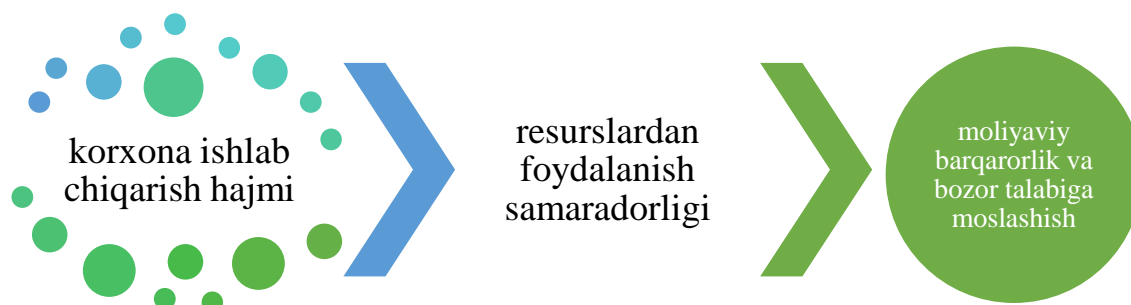
1-rasm. Oilaviy korxonalar samaradorligi indeksiga ta’sir qiluvchi omillar

Oilaviy korxonalar faoliyati ko‘pincha korxonaga egalarining tashabbusi bilan boshlanadi, biroq ko‘p hollarda korxonani keyingi rivojlanish bosqichiga olib chiqish uchun zarur bo‘lgan tajriba, resurslarni samarali boshqarish va ishlab chiqarish hajmini oshirish ko‘nikmalariga ega bo‘lmaydi. “Oilaviy korxonalar samaradorligi indeksi” orqali butun dunyo amaliyotida oilaviy korxonalar rivojlanish sur‘atlari tahlil qilinadi va faoliyatiga ta’sir etuvchi ichki va tashqi omillar aniqlanadi. Shu sababli, oilaviy korxonalar samaradorligi indeksida korxonaga ishlab chiqarish hajmi, resurslardan foydalanish samaradorligi, moliyaviy barqarorlik va bozor talabiga moslashish kabi ko‘rsatkichlar 1-rasmda keltirilgan.