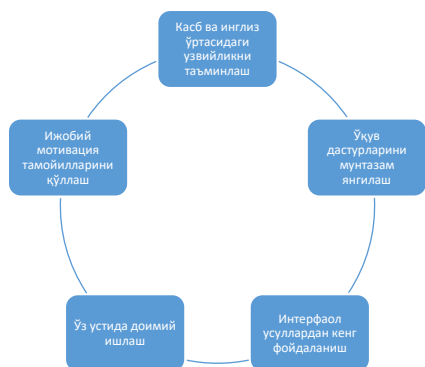
1, 2-rasm. Samarali usullarni aniqlashtirish mexanizmlari

Tahlil va natijalar. Talabalarining maqsadlari, istak va hohishlarini aniq belgilash pedagogik mahoratning asosini tashkil qiladi. Toshkent pediatriya tibbiyot instituti mutaxassislik kafedralari pedagog xodimlari hamda ingliz tili o'qituvchilari o'rtasida talabalarining ingliz tilini o'rganishga bo'lgan qiziqishlarini orttirishda samarali usullar bo'yicha fikrlar aniqlandi. Bunda ingliz tili o'qituvchilari (1-rasm) hamda mutaxassislik kafedralari pedagog xodimlari (2-rasm) tomonidan bildirgan fikrlar yig'indisi namoyon bo'lib, samarali usullar mexanizmlari aniqlandi.