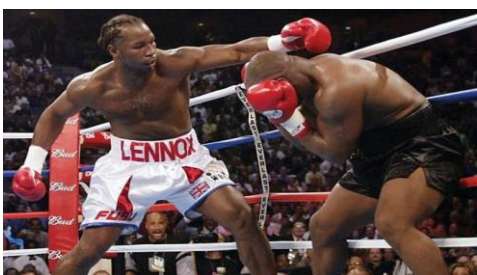
Lennoks Lyuis — Mayk Tayson

Hozirgi kunda boks butun dunyoning eng mashhur va ommabop sport turlaridan birir hisoblanadi. Ko'plab odamlar esa bunga qarshi ushbu sport turini biznes deb ham o'ylashadi. Ushbu gap-so'zlarda esa qaysidir ma'noda jon bor va boks ommaboplikdan tashqari eng ko'p daromad keltiradigan sport turlaridan biri hamdir. Ringda tashkillashtiradigan birgina jangdan esa aql bovar qilmas darajada daromad orttirish mumkin. To'g'ri ta'kidlaganimizdek, quyida boks tarixidagi eng qimmat janglar haqida fikr yuritib o'tamiz.