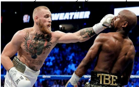
Floyd Mayvezer- Konor Makgregor

Natija: 12 raundlik jangda hakamlar qaroriga ko'ra Meyvezer g'alaba qozonadi.