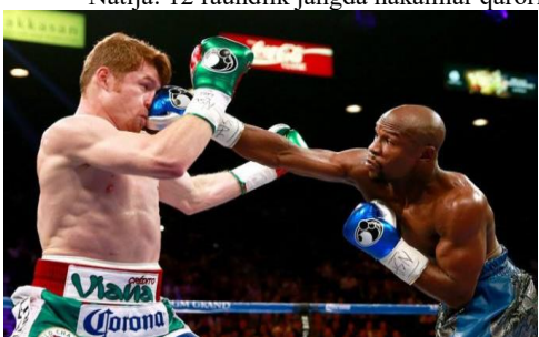
Floyd Meyvezer — Saul Alvares

Natija: 12 raundlik jangda hakamlar qaroriga ko'ra Meyvezer g'alaba qozonadi.