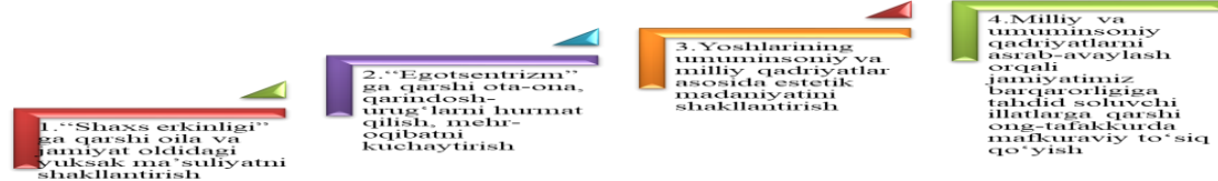
2-rasm. Yoshlarni milliy qadriyatlarga sodiqlik ruhida tarbiyalash bosqichlari

Yoshlarni milliy qadriyatlarga sodiqlik ruhida tarbiyalash borasida quydagilarni taklif qilish mumkin (2-rasm).