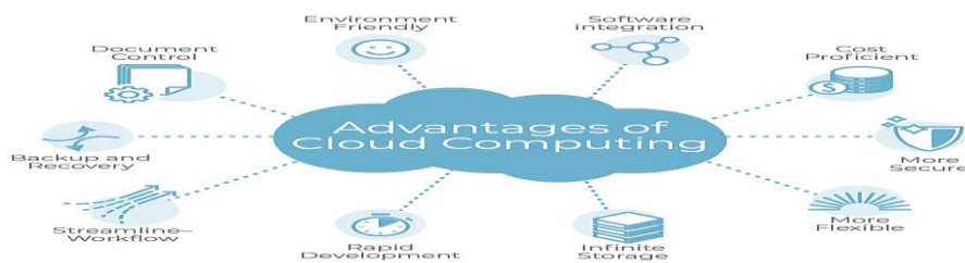
2-rasm Bulutli texnologiyalarning afzalliklari

Bulutli hisoblashlarda fayllardan erkin foydalanish imkoniyati mavjudligi. Agar ma'lumotlar bulutda saqlanilayotgan bo'lsa, bu ma'lumotlardan istalgan vaqtda iste'molchilar foydalanishlari mumkin.