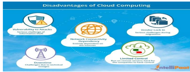
3-rasm. Bulutli texnologiyalar kamchiliklari.