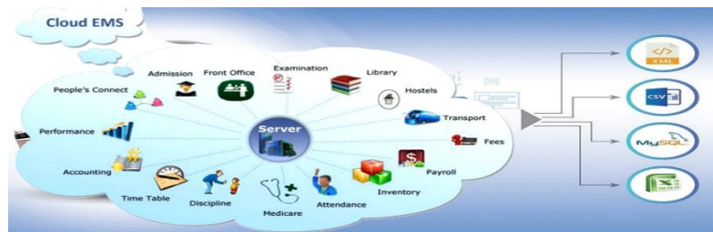
4-rasm. Bulutli texnologiyalarda internet ta'lim tizimi.

Quyida keltirilgan tizim modeli bulutli texnologiyalar asosida yagona platformada ta'lim tizimini tashkillashtirish va boshqarishni tafsiya qilamiz.