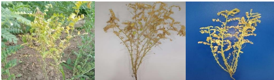
2-Rasm. No`xatning fuzarioz bilan kasallangan o`simlik namunalari.

Jadvaldan ko`rinib turibdiki no`xatlarning umumiy unuvchanlik foizi o`rtacha 85% ni tashkil qildi. No`xat o`simligining hosildorligi uning pastki dukkak balandligi va shoxlanish tipiga bog`lik bo`ladi, lekin shunga qaramasdan shoxlanish tipi tik bo`lgan namunalarda yirik donli lekin dukkak soni jihatdan kamroq, shoxlanishi yuqori bo`lgan namunalarda esa dukkak va don soni ko`p, lekin mayda donli bo`lishi kuzatildi. Shu bilan birga gulband uzunligi ham dukkak hajmi bilan chambarchas bog`liq. Yirik donli no`xat namunalari ko`proq qismi CIENMED namunalari orasida ko`p uchradi. Namunalar ichida miqdoriy belgilari yaxshi ko`rsatkichga ega namunalarga CIFWN namunalari 17 tasida CIENMED namunalari 11 tasida yuqori ko`rsatkichga ega bo`ldi.